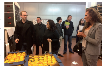
La délégation d'acheteurs

Saint-Charles Export leur avait concocté un programme intensif de 20 rendez-vous. Les entretiens ont eu lieu au sein même des entreprises et des exploitations agricoles, avec notamment des visites de serres et de stations d'expédition.