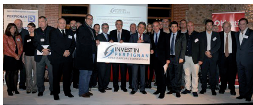
Les ambassadeurs du territoire