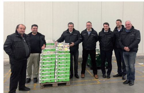
La délégation lors d'une visite d'entreprise

Tous étaient intéressés par une large gamme de produits pouvant répondre à leurs standards ! Nul doute que la force commerciale et les efforts déployés par les entreprises membres de Saint-Charles Export en termes de qualité en ont interpellé plus d'un.