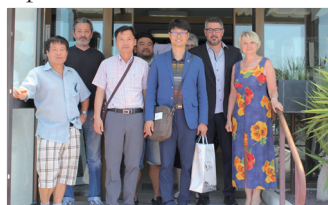
Délégation coréenne Association des maires

Parmi les différentes réunions organisées à Saint-Charles depuis notre dernière édition, voici une sélection de délégations reçues sur la plateforme.