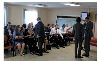
Société Générale Réunion des directeurs d'agence P.O. et Aude