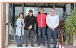
SUNGIVEN FOOD Chaîne de supermarchés en Chine