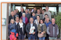
Agrylis Délégation producteurs

Parmi les différentes réunions organisées à Saint-Charles depuis notre dernière édition, voici une sélection de délégations reçues.