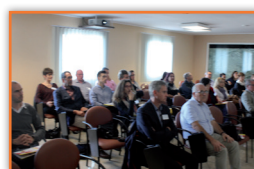
DIRECCTE Délégation 30 pers.