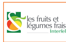
Interfel Équipe de direction