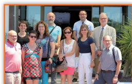
DRAAF Occitanie Délégation