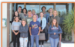
Bac Pro Industries Étudiants

Parmi les différentes réunions organisées à Saint-Charles depuis notre dernière édition, voici une sélection de délégations reçues.