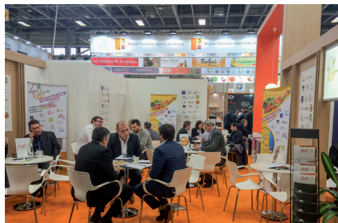
L'espace collectif du groupement Saint-Charles Export

Cette année, le port de commerce de Port-Vendres a été représenté, en force, à la fois par le gestionnaire du port, la Chambre de Commerce et d'Industrie de Perpignan, et par l'opérateur portuaire, CLTM ( Comptoir Languedocien de Transit et de Manutention ). Les atouts, en termes de transport et de logistique de la Plateforme Multimodale Pyrénées Méditerranée ont également été mis à l'honneur à l'occasion de ce salon.