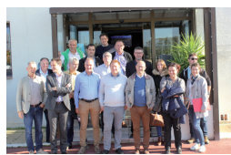
COOP de France